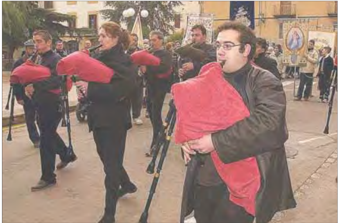
▶ Imatge d'arxiu d'una edició anterior de la Trobada de Sacaires que es fa cada any a Riudoms.

El Grup de Dones de la Selva del Camp organitza aquesta tarda, a partir de les quatre, una xerrada a la sala de la Cooperativa. La xerrada anirà a càrrec de la coordinadora territorial de l'Institut Català de la Dona a la província de Tarragona, Lídia Bargas. Demà també està prevista la projecció de Salvator Giuliano , de F. Rossi (1962), dins el cicle de Cinema dels 60 que organitza la Filmoteca. L'acte, que començarà a dos quarts de deu de la nit al Castell de la Selva del Camp, està organitzat per l'Àrea de Cultura de l'Ajuntament d'aquesta localitat del Baix Camp.