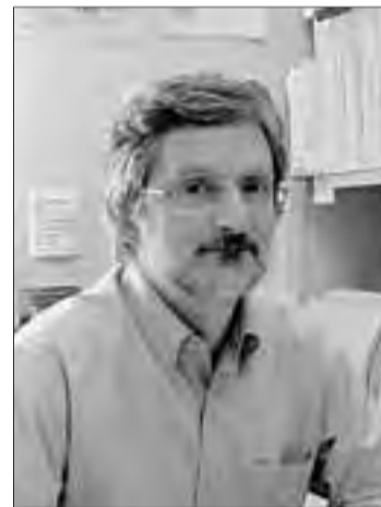
Imatge del director de la FUNCA.

Quines proves es fan per detectar aquest càncer?