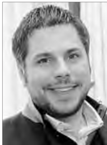
Batet destaca la importancia de estar en Fitur.

peradores envían a sus clientes a nuestra zona. El año pasado notamos un incremento y las previsiones para 2012 son mejores. El mercado nacional está un poco más flojo», comenta Graset.