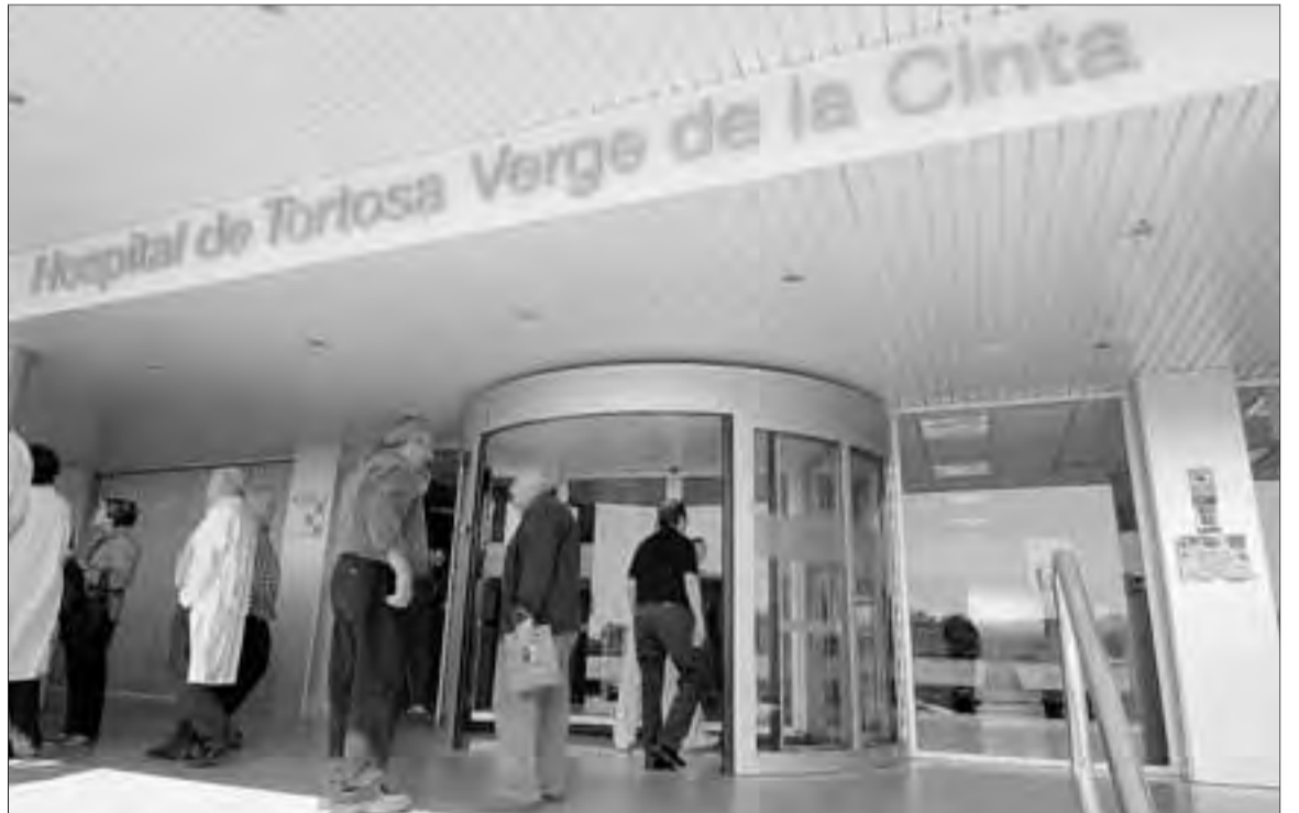
Les mostres de femta s'analitzaran al laboratori de l'Hospital Verge de la Cinta.

Uncop analitzades les mostres al laboratori de l'Hospital Verge de la Cinta de Tortosa, el Departament informarà per carta els