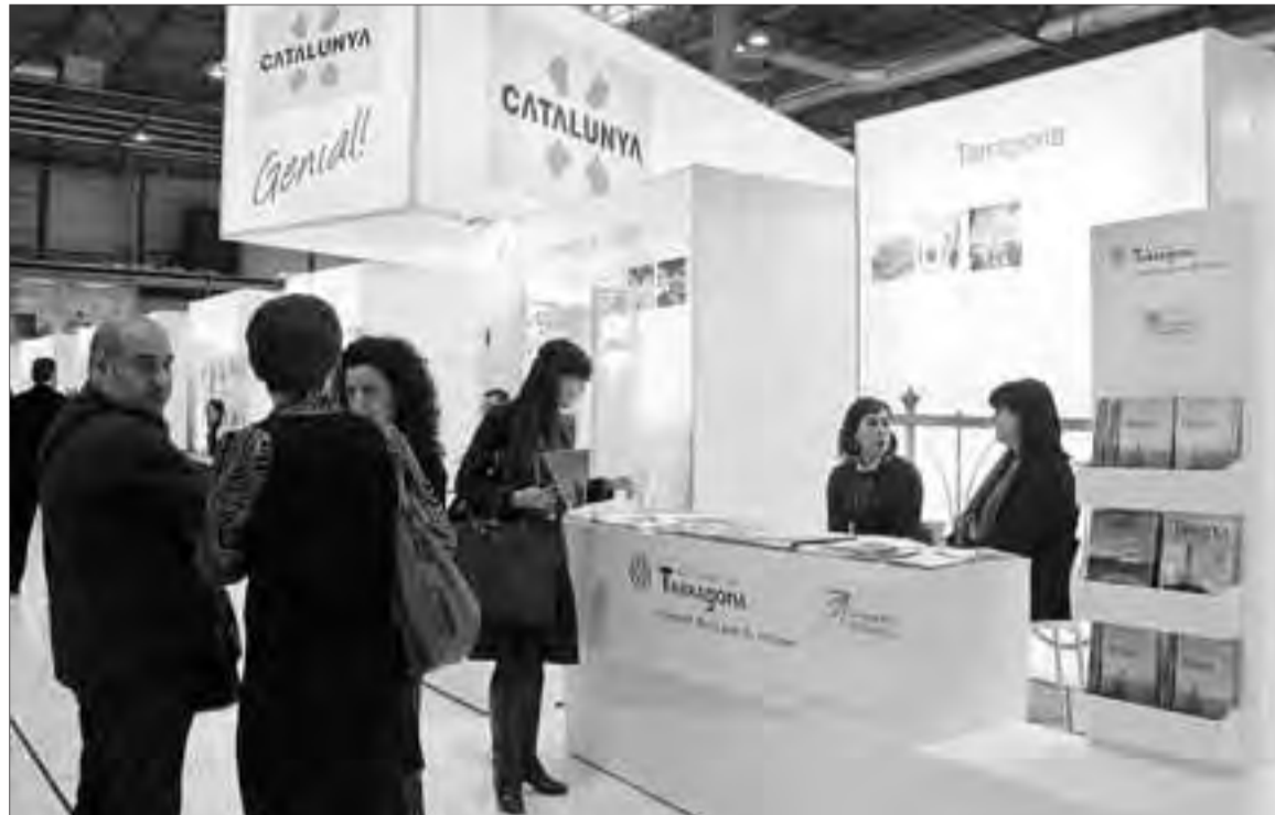
La Costa Daurada se promociona dentro del stand de la Agència Catalana de Turisme.

Atraer la atención del turismo ruso es uno de sus objetivos. «La llegada de turistas rusos y del este de Europa ha aumentado en La Pineda. Los touro-