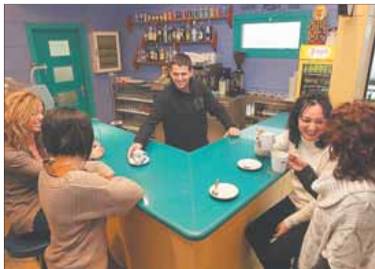
▶ Imatge, ahir a la tarda, del bar del pavelló poliesportiu.