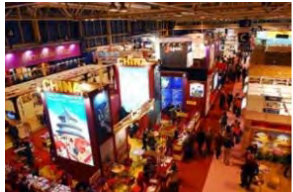
Imatge de l'interior de la Fitur de Madrid

La participació a Fitur permetrà a tots aquests organismes definir línies de treball, estratègies i aliances empresarials per tal de dinamitzar i reforçar l'activitat turística, innovant per atendre les demandes del mercat. Fitur és una de les principals fires turístiques del món. Enguany comptarà amb 9.500 expositors de 167 països i territoris, que ocupen deu pavellons del recinte firal madrileny. En la passada edició, el certamen va aplegar més de 209.000 visitants, entre professionals i públic en general.