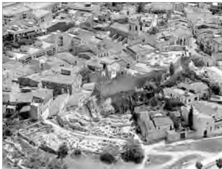
El Pla de Barris de Calafell contempla la mejora y acondicionamiento del entorno del núcleo antiguo del municipio.

Solé, por su parte, incidió en que «éste es un plan transversal, en el cual se implican todas las concejalías», y apuntó que