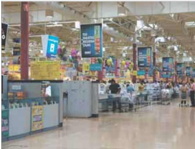
La cadena de distribución explicó que la iniciativa es fruto de una propuesta de la dirección española debido a la crisis económica.

El objetivo de la campaña es «ayudar en sus economías a este colectivo, por ser el más vulnerable y numeroso». Según el INE, el Ministerio de Trabajo y el IMSERSO, el 86% de los mayores de 65 años recibe una pensión, siendo la retribución media de 810 euros y la mínima de 347 euros.