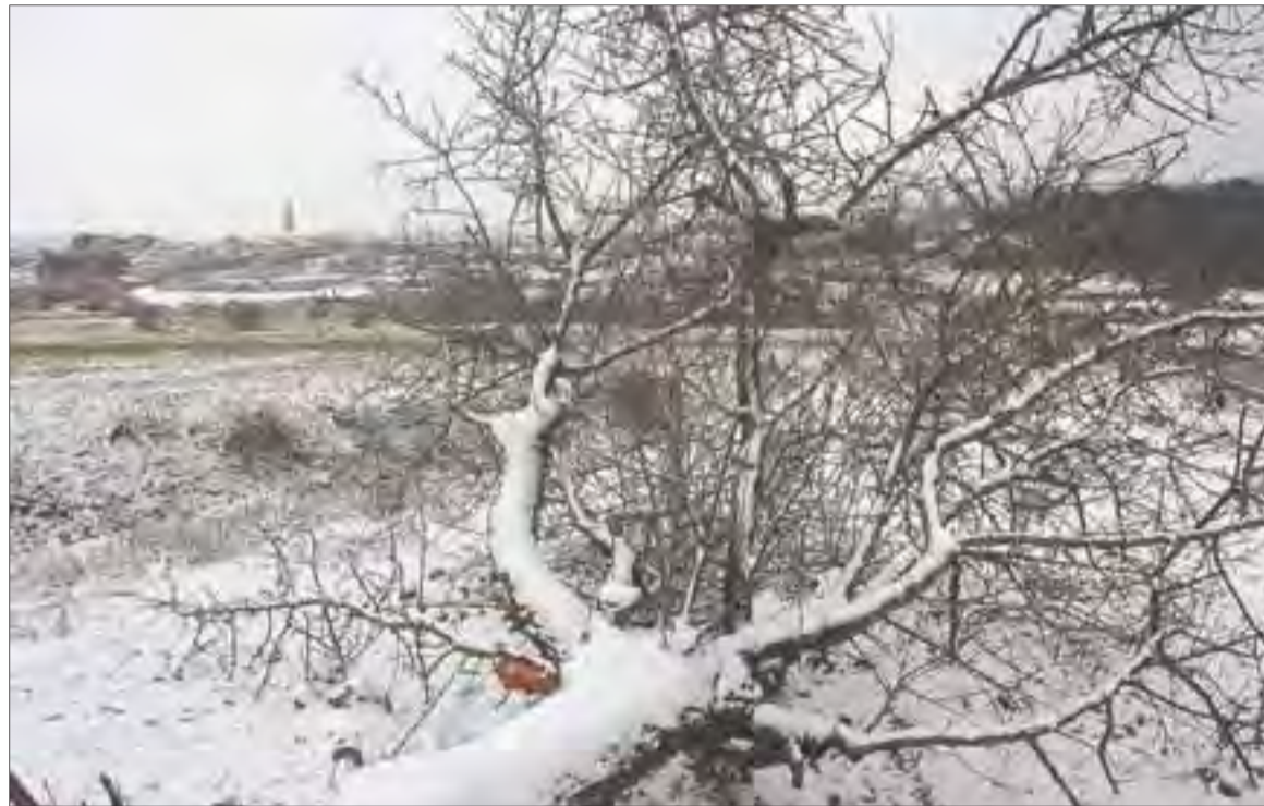
Aspecto que ofrecía ayer Rocafort de Queralt, en la Conca de Barberà.

La primera fase de la ola de frío rozó sólo el norte de las comarcas de Tarragona, aunque se intensificó en la Conca de Barberà, la comarca más afectada del Camp de Tarragona por la nieve, con gruesos de unos dos centímetros a media mañana en poblaciones como Rocafort de Queralt, Les Piles de Gaià o Santa Coloma de Queralt. El Consell Comarcal suspendió las rutas de transporte escolar hacia Santa Coloma de Queralt desde todos los pueblos cercanos, y también las que desde este punto se tenían que dirigir a Montblanc. La circulación por las carreteras principales era cómoda pero se complicaba en las secundarias, donde se acumulaban placas de hielo. A primeras horas de la mañana, el Servei Català de Trànsit anunció que se necesitaban