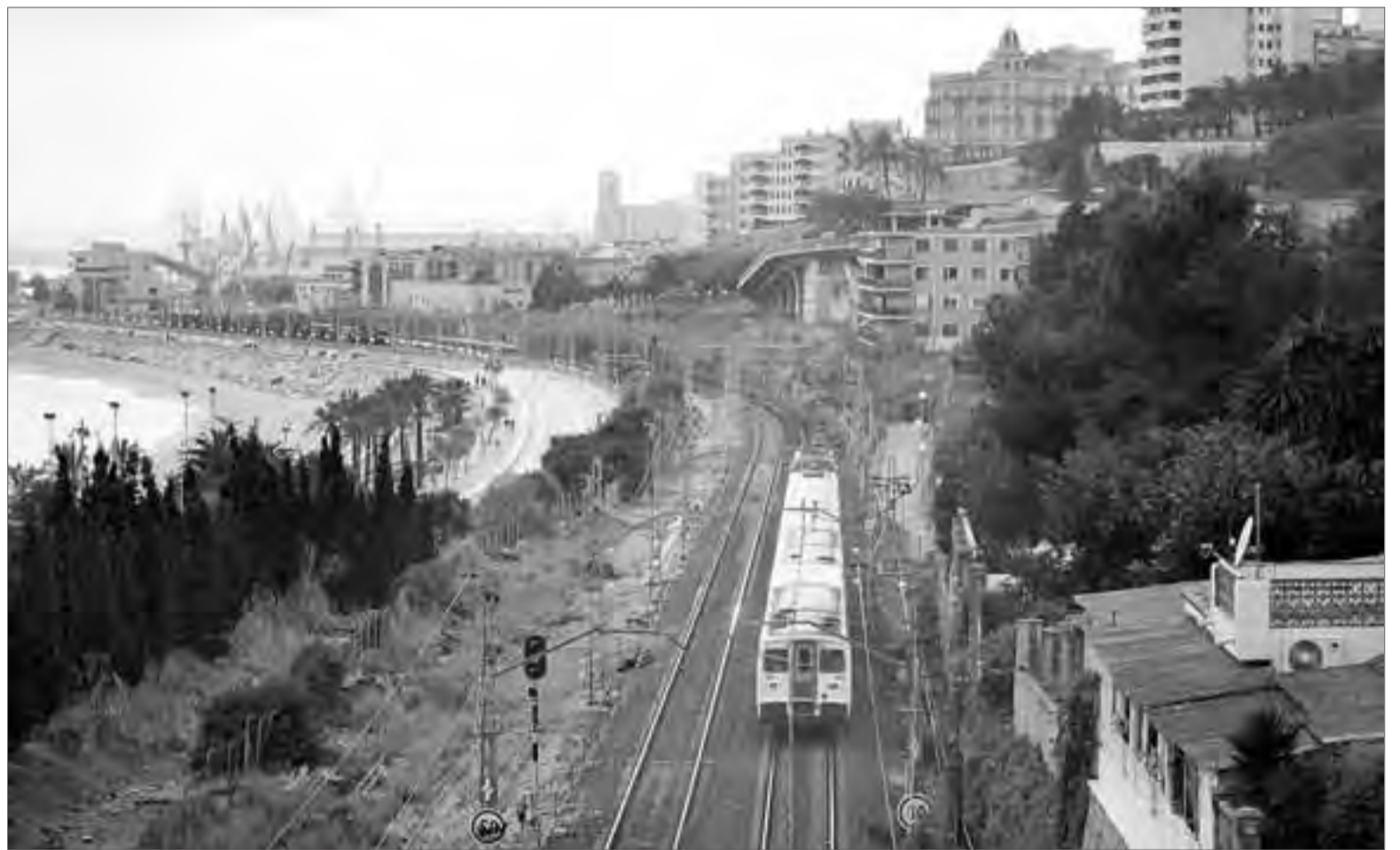
El tercer raíl para adaptar el ancho ibérico al europeo se situaría en la vía más cercana al litoral tarragonense.