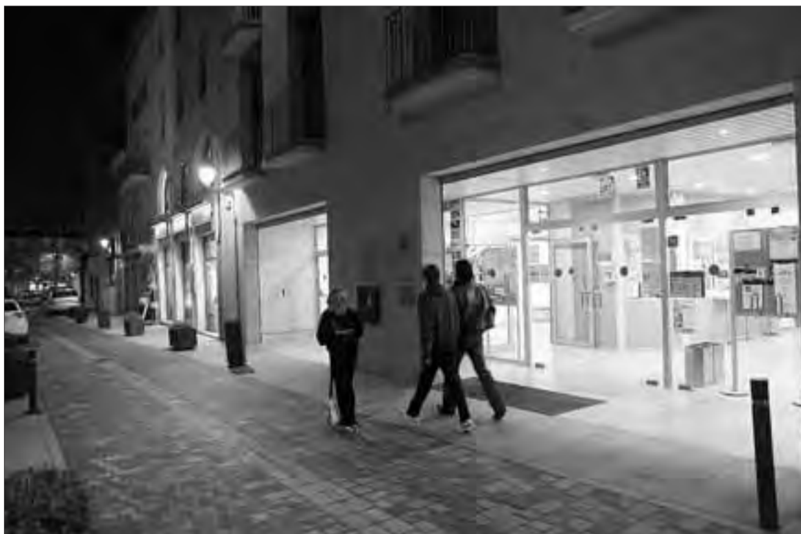
Los profesores dicen que los retrasos pueden afectar a más profesionales del centro (en la imagen).

CAMBRILS ■ LA DEUDA CON LOS PROFESIONALES ASCIENDE A 2.400 EUROS