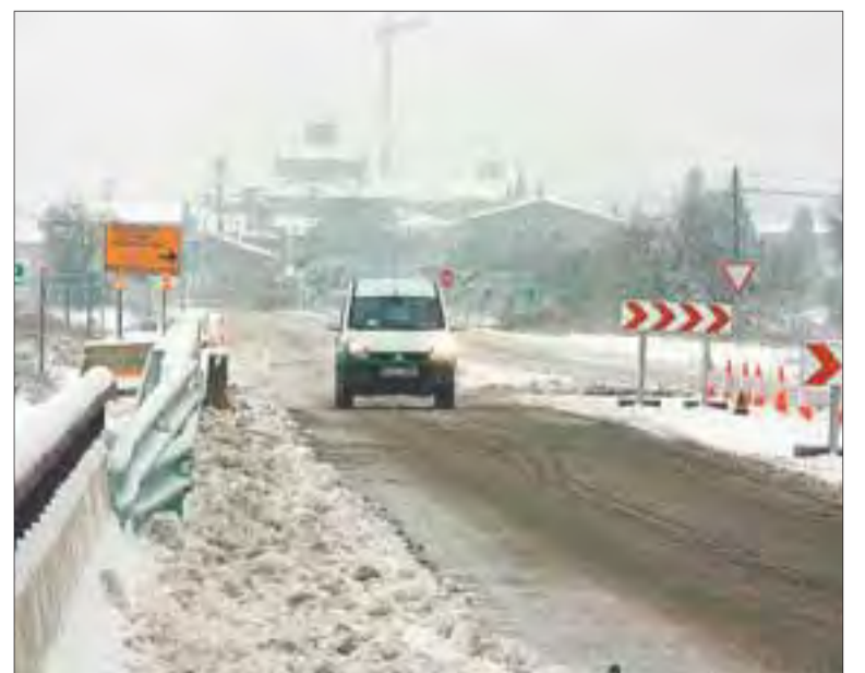
La localidad de Sant Ramon, en La Segarra, fue una de las más afectadas por la nevada.

En puntos de Ucrania y Polonia se registraron temperaturas por debajo de los -30 grados, mientras que en algunas zonas de los Urales y de Siberia, en Rusia, se llegaron a los 40 grados negativos.